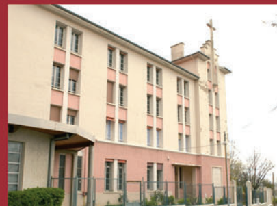
Les Chartreux - Prépas CPE