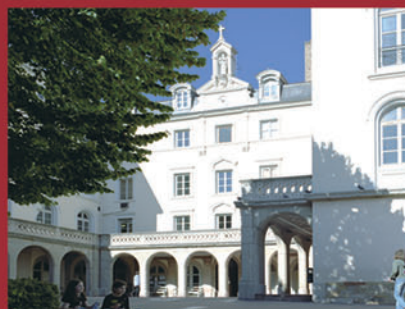
Ecole - Collège - Lycée Les Chartreux