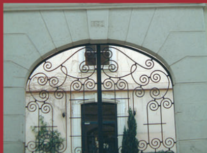
Institution Les Chartreux - Ste Famille