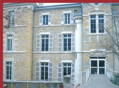
Collège Les Chartreux - St Charles