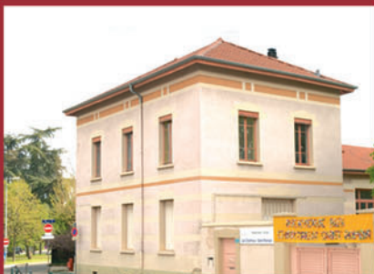
Ecole Les Chartreux - St Romain