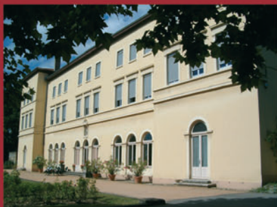
Les Chartreux - St Irénée - Internat Prépas CPE