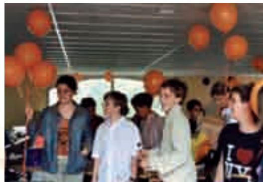
Fête en l'honneur des enfants de Mokattam et du Soudan, 21 mai 2005

En une dizaine d'années, j'ai vu une œuvre de solidarité, qui nécessitait toujours plus de dons, prendre l'innocence et l'enthousiasme d'un jeu : les kermesses se sont succédé, au même titre que les tentatives les plus nobles et les plus farfelues : des concerts de rock à la vente de poissons rouges, les farces annuelles, auxquelles nous prenions le plus vif plaisir, s'avéraient réellement utiles. Les rencontres avec Sœur Emmanuelle en témoignaient, quoique la gravité du problème semblait, pour nous, s'élever dans les airs, en un nuage d'oranges gonflables, s'effacer au-dessus de la Méditerranée et se confondre dans les rires des enfants des deux pays.