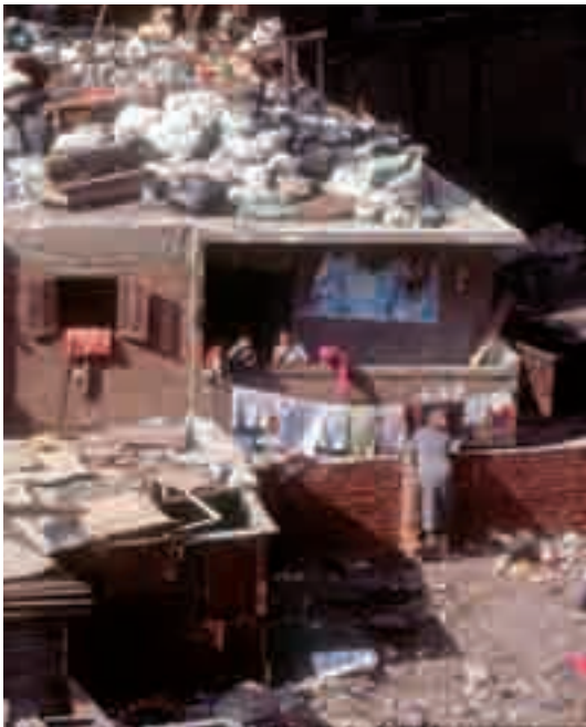
Vue du quartier de Mokattam, février 2001

Philippe Tessieux, pour l'équipe Mokattam-Soudan Les Chartreux