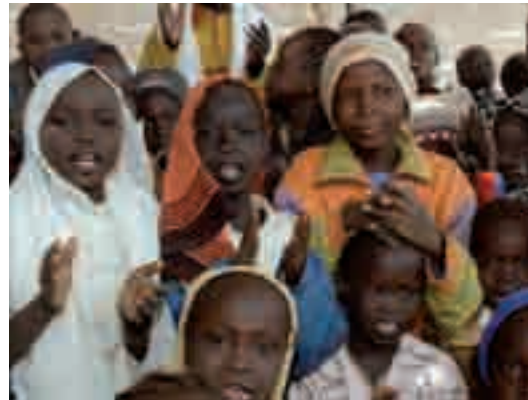
Enfants du centre de nutrition de Karyal, Karthoum, Soudan, février 2008

après le lycée. Succès insoupçonné, qui oppose à l'idée d'une conscience humanitaire vaine celle d'une humanité solidement partagée, sur des bancs d'écoliers qu'il a fallu forger.