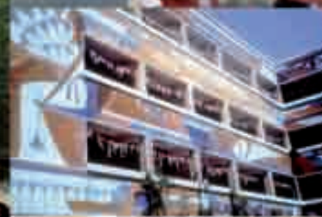
L'École de Mokarram