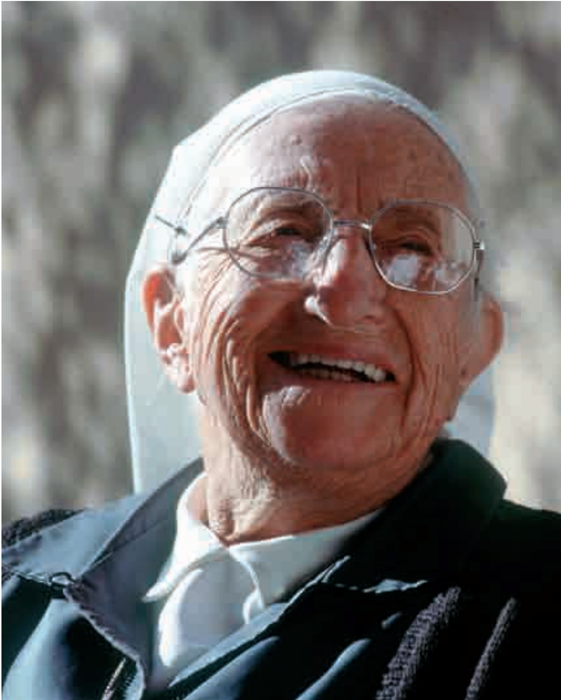
Sœur Emmanuelle, Callian, novembre 1998.