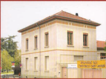
Ecole Les Chartreux - St Romain