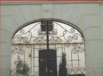
Institution Les Chartreux - Ste Famille