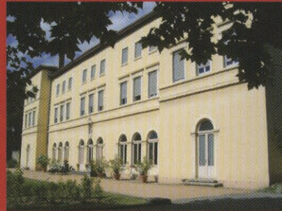
Les Chartreux - St Irénée - Internat Prépas CPE