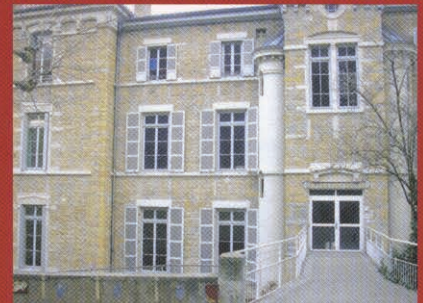
Collège Les Chartreux - St Charles