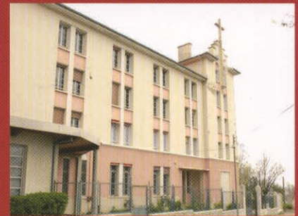
Les Chartreux - Prépas CPE